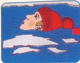
Не погружаться в воду с головой