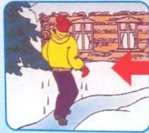
Не отдыхая, бежать к близкому жилью