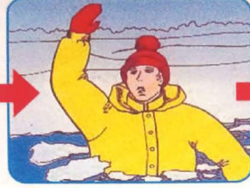
Не паниковать, позвать на помощь