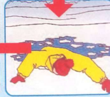
Наползать на лёд, раскинув руки в стороны