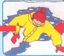
Забросить на лёд ногу, откатиться от полыньи