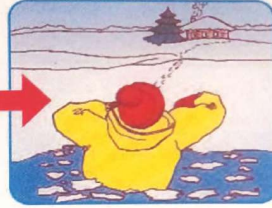
Выбираться в сторону, с которой произошло падение